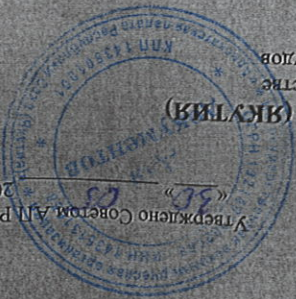
ГРАФИК ДЕЖУРСТВ АДВОКАТОВ ХАНГАЛАСКОГО РАЙОНА РЕСПУБЛИКИ САХА (ЯКУТИЯ) для участия в уголовном, гражданском и административном судопроизводстве по назначению органов дознания, органов предварительного следствия и судов (в порядке ст. 51 УПК РФ, ст. 50 ППК РФ, ст. 54 КАС РФ) на июль месяц 2024 года Утверждено Советом АП РС (Я) _____ 2024 г.